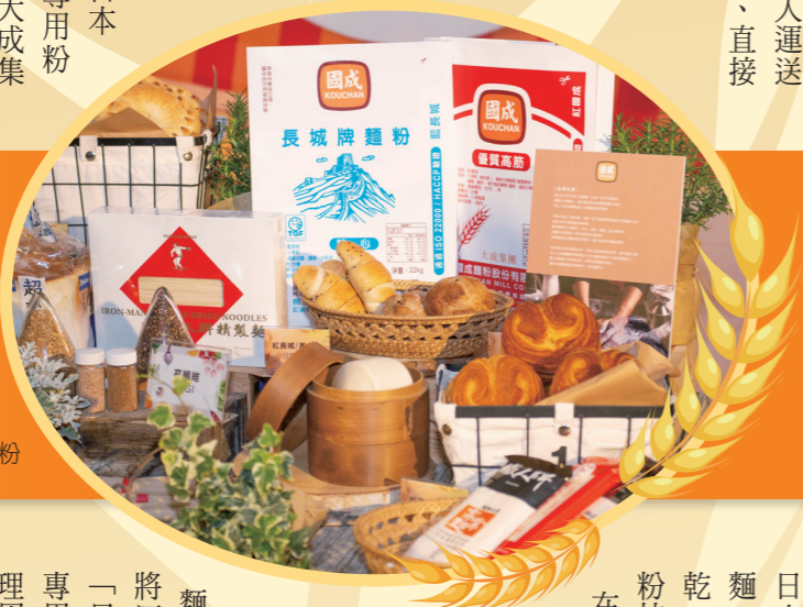
▶ 大成集團優質麵粉

蛋進行包裝，初生卵的口感較一般雞蛋Q彈、香氣充滿濃郁的蛋黃香！自有農場中剛出生的初生卵，即刻由專人運送到牧場裡的洗選廠並且迅速包裝、直接運送，新鮮吃得到！