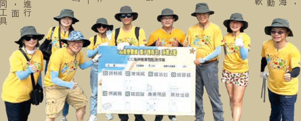
ICC 海岸廢棄物 監測作業紀錄

在講解完淨灘活動說明後，大家開始進行淨灘活動主籌——清理海洋廢棄物，面對眼前的各種廢棄物大家利用不同工具不同的方式努力的清除與收集廢棄物，有的同仁兩人一組，一人