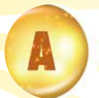
維生素A 維持暗處視覺 夜晚依舊晶亮