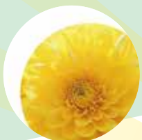
FloraGLO 游離型葉黃素 守護晶亮世界 足量添加