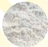
葡萄糖酸鋅 減少視網膜受損 增加眼睛抵抗力 提高清晰度