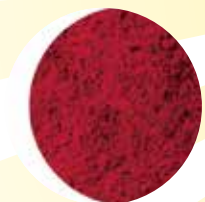
AstaZine 蝦紅素 自在享受高採光 保護力再升級